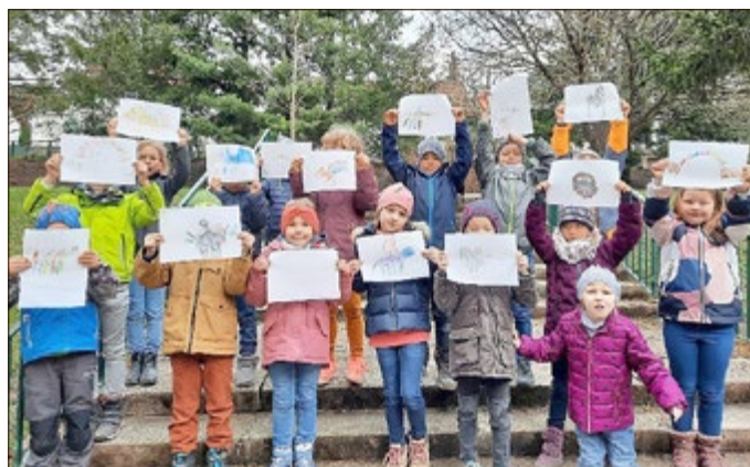
Klasse 1b aus der Grundschule Friedrichroda, die ihre Zeichnungen zum vorgelesenen Text präsentieren; fotografiert hat Angela Schwarz