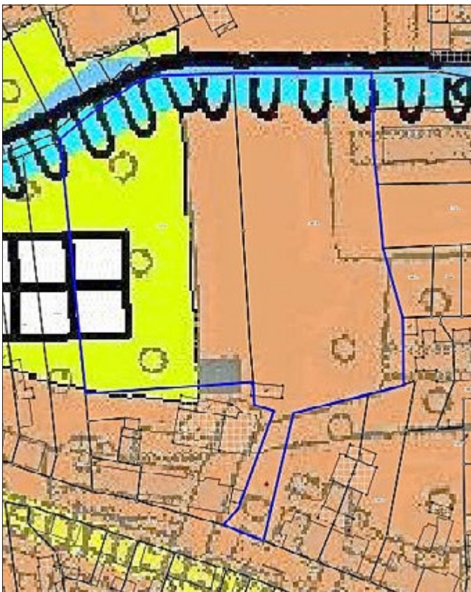
Ausschnitt Fläche Flächennutzungsplan