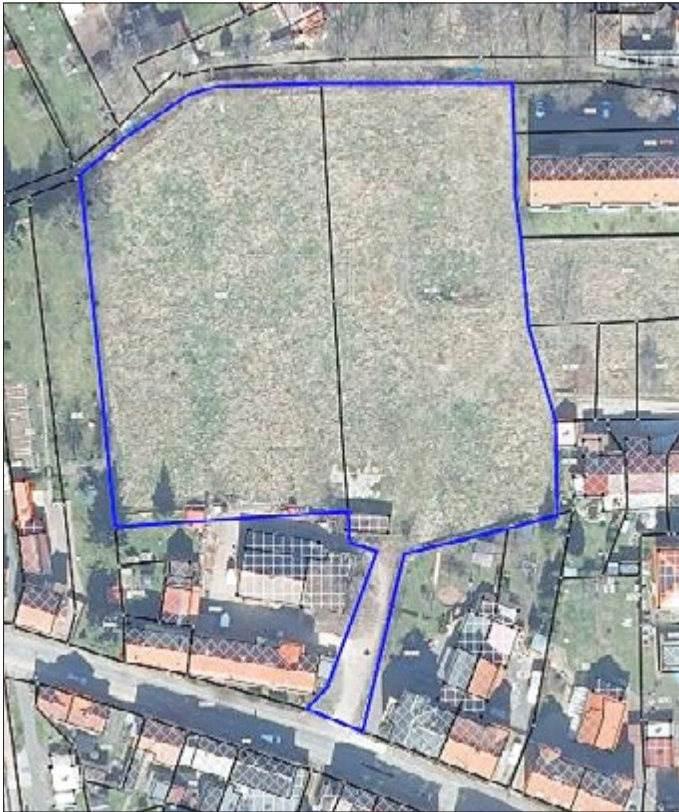
Ausschnitt Fläche Luftbild